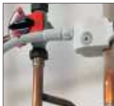
Простая система крепления клеммы с вкладышами

Можно использовать на параллельных трубах и в труднодоступных местах