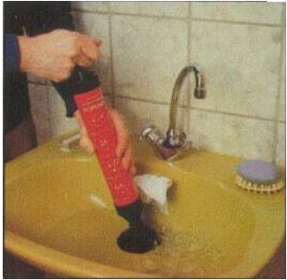
ROPUMP устраняет засоры в раковинах