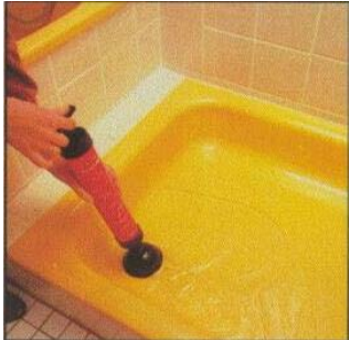
ROPUMP устраняет засоры в душевых