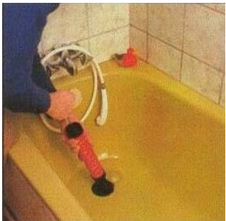
ROPUMP устраняет засоры в ваннах