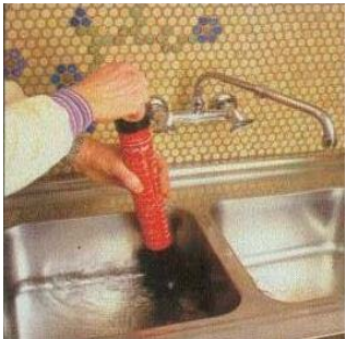
ROPUMP устраняет засоры в мойках